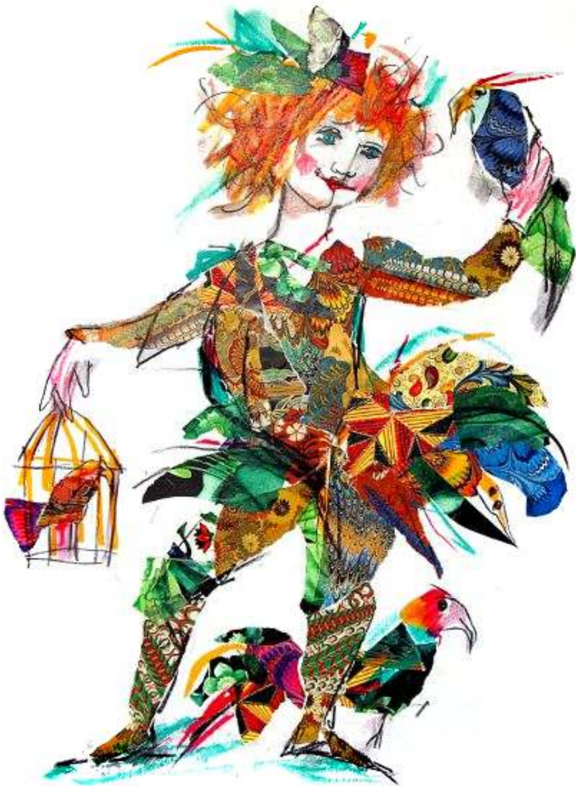
Papageno. Ilustración de Emanuele Luzzati