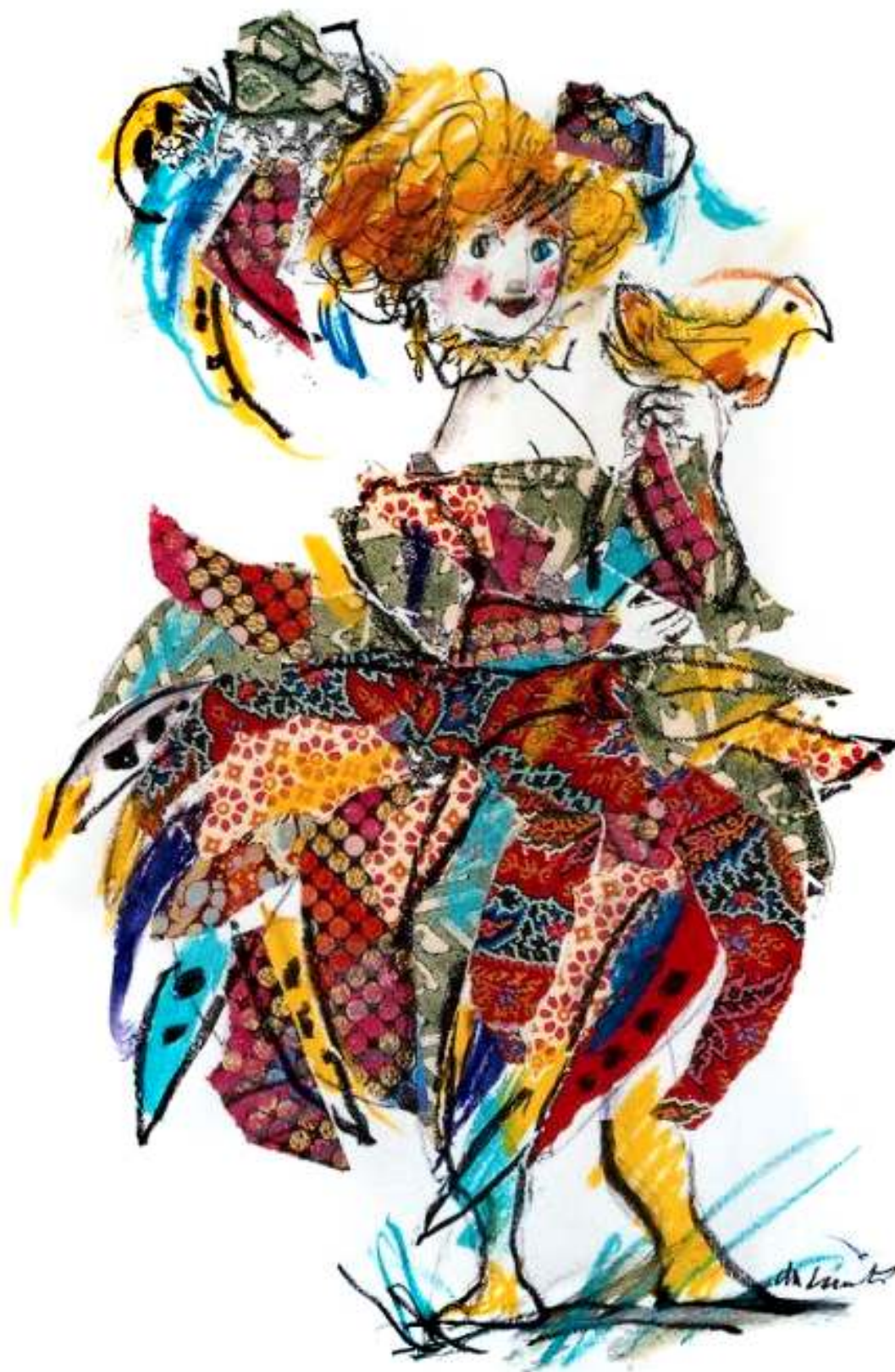
Papagena. Ilustración de Emanuele Luzzati