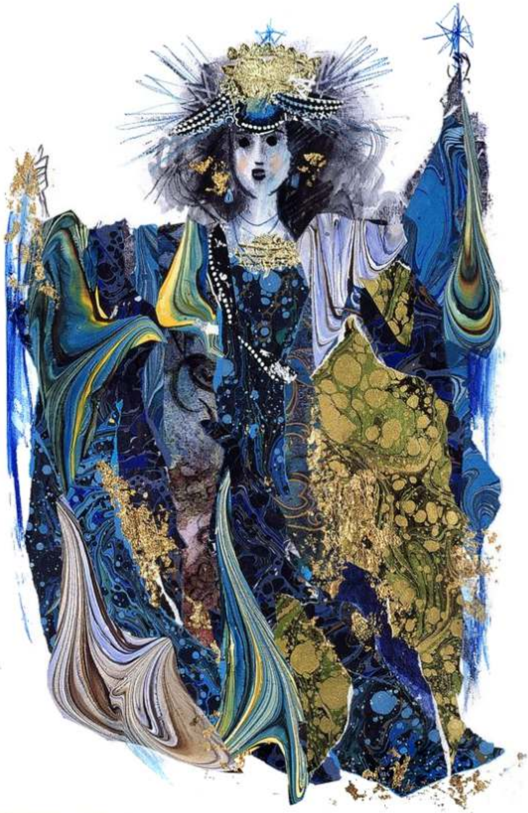
La Reina de la Noche. Ilustración de Emanuele Luzzati