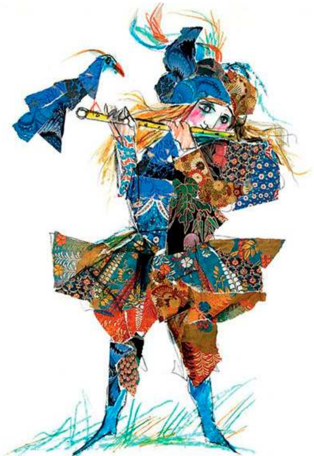
Tamino. Ilustración de Emanuele Luzzati